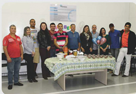
Café com aniversariantes.

A Tamarana Tecnologia comemora os aniversariantes do mês de forma especial e educativa. Na celebração realizada em