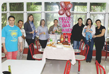
Homenagem da Tamarana às mães.