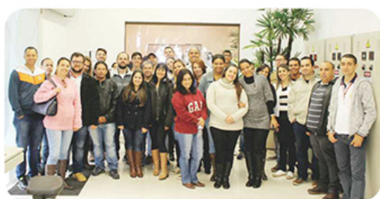
Grupo de estudantes da Fatec, de Presidente Prudente (SP).