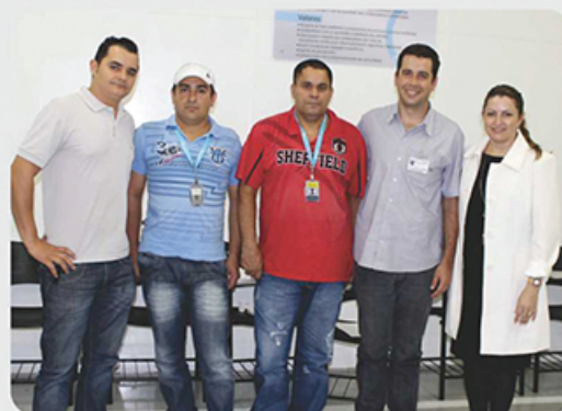
Lideranças que participaram do curso.