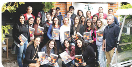
Alunos do curso de Química Industrial da Fema, de Assis (SP).

Todo o conhecimento e expertise da Tamarana Tecnologia, na área em que atua, desperta constantemente o interesse de empresas, entidades e instituições de ensino e pesquisa. Os visitantes, sempre bem-vindos, são recepcionados pelos gestores, que abrem as portas da Tamarana, compartilhando os conhecimentos adquiridos.