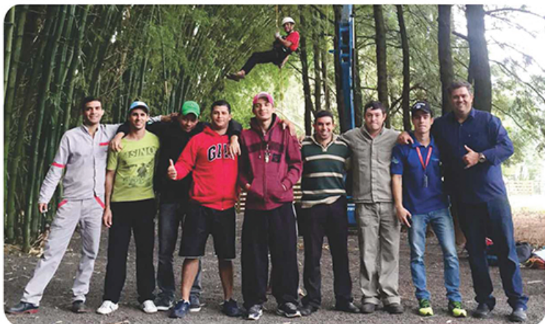
Profissionais durante o treinamento anual de Brigada de Emergência.